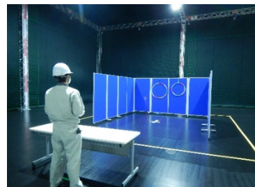
ドローン操作実習