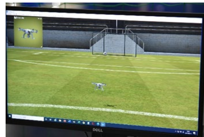
フライトシミュレータ実習