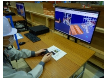
シミュレータ実習の様子